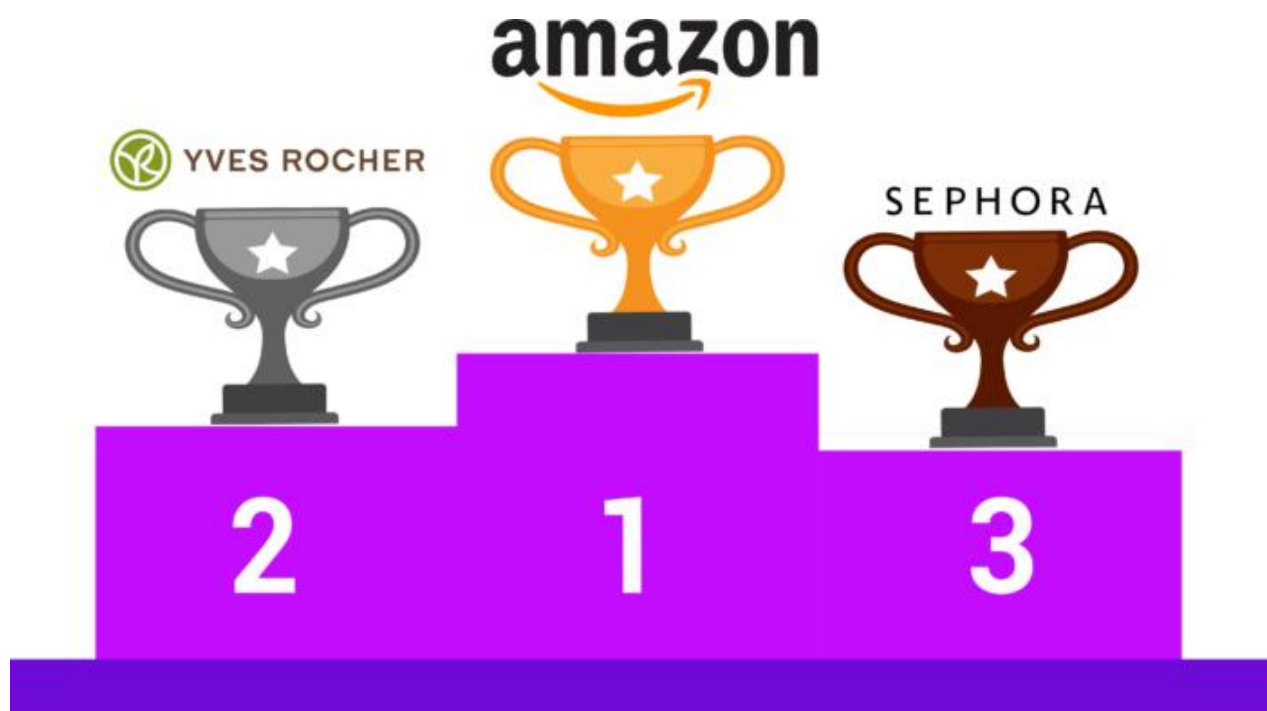
Classement 2020 des sites e-commerce beauté en nombre de clients – FEVAD .

En 2020, les cyber acheteurs ont privilégié l'achat en ligne de produits de beauté chez un géant du commerce en ligne : Amazon (25,1 % des e-acheteurs y ont passé commande d'un cosmétique). Yves Rocher talonne de près l'entreprise de Jeff Bezos, avec 24,4 % d'acheteurs, suivi de près par Sephora et Nocibé.