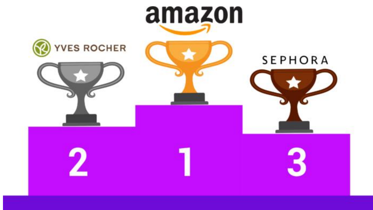
Classement 2020 des sites e-commerce beauté en nombre de clients – FEVAD .

En 2020, les cyber acheteurs ont privilégié l'achat en ligne de produits de beauté chez un géant du commerce en ligne : Amazon (25,1 % des e-acheteurs y ont passé commande d'un cosmétique). Yves Rocher talonne de près l'entreprise de Jeff Bezos, avec 24,4 % d'acheteurs, suivi de près par Sephora et Nocibé.